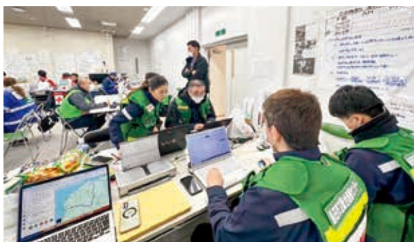
支援活動に従事する当院DMAT隊員

今回の災害派遣を経験し、当院としても甚大な被害が予想される南海トラフ地震に対し、災害への備えがより一層重要であることを再認識しました。当院の災害マニュアルの見直しや備蓄の準備、災害対応訓練などに力を入れていきたいと考えております。